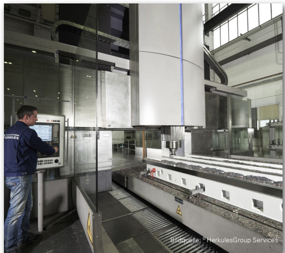
Portalfräsmaschine mit mehr als 10 m Durchgangsbreite, die ProfiMill-Serie von WaldrichSieggen